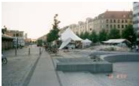
Festival på Halmtorvet ud for Onkel Dannys Plads

Tekst og rutelægning Christian Kirkeby, Lokalhistorisk Forening 2009