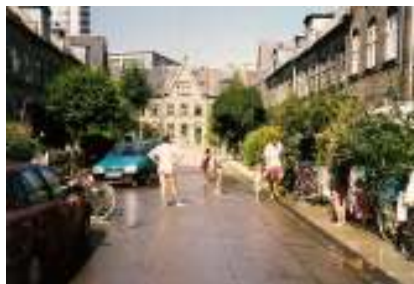
Vandplaskeri i Humleby på en varm sommerdag